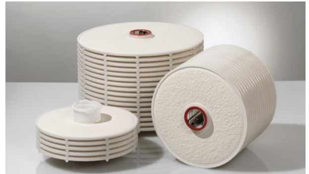
Vazão de água na série BECODISC BS

Cartuchos de discos modulares BECODISC para atingir um alto grau de clarificação. Esses cartuchos de discos modulares retêm partículas ultrafinas com maior confiabilidade e possuem efeito de redução de germes, o que faz com que sejam especialmente adequados para filtração de líquidos livres de bruma antes da armazenagem e do engarrafamento.